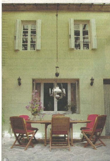
Terras van de watermolen

Uw goed recht Woning-APK is geldklopperij 49 Mobiel Hoge kwaliteit in AD-fietstest 50