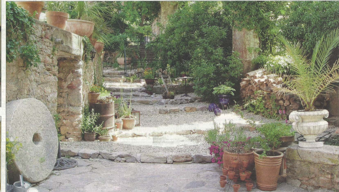
In hun park ontdekken de eigenaren nog dagelijks nieuwe dingen. Maar waar ze het decor hebben opgeknapt ontstaat een geweldige sfeer.